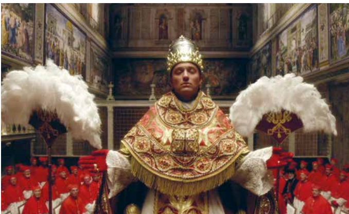
THE YOUNG POPE

The new pope is het vervolg op the young pope . Beide series zijn van de hand van Paolo Sorrentino. Met een topcast – in een spectaculaire beeldtaal die vergezeld gaat met vette Italiaanse discobeats – bekritiseert hij de zwakheid van de mens, de geschiedenis van het Vaticaan en de perversiteit van absolute macht. Van een grote schoonheid! (MD)