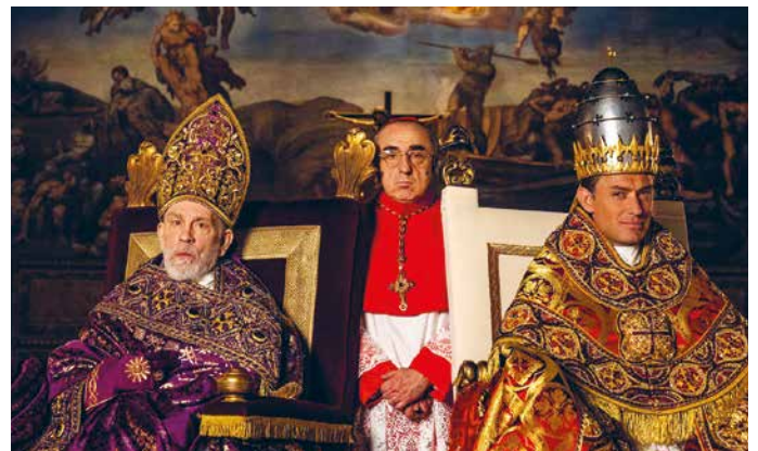
THE NEW POPE