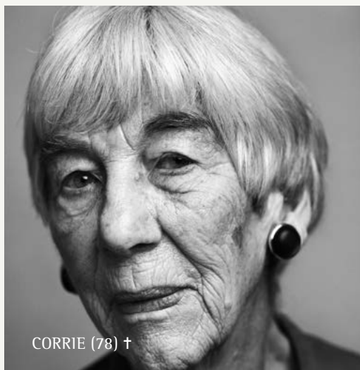
CORRIE (78) †

'DE DOOD, ZO DICHTBIJ, VOEGT VEEL SCHOONHEID TOE AAN ELKE DAG'